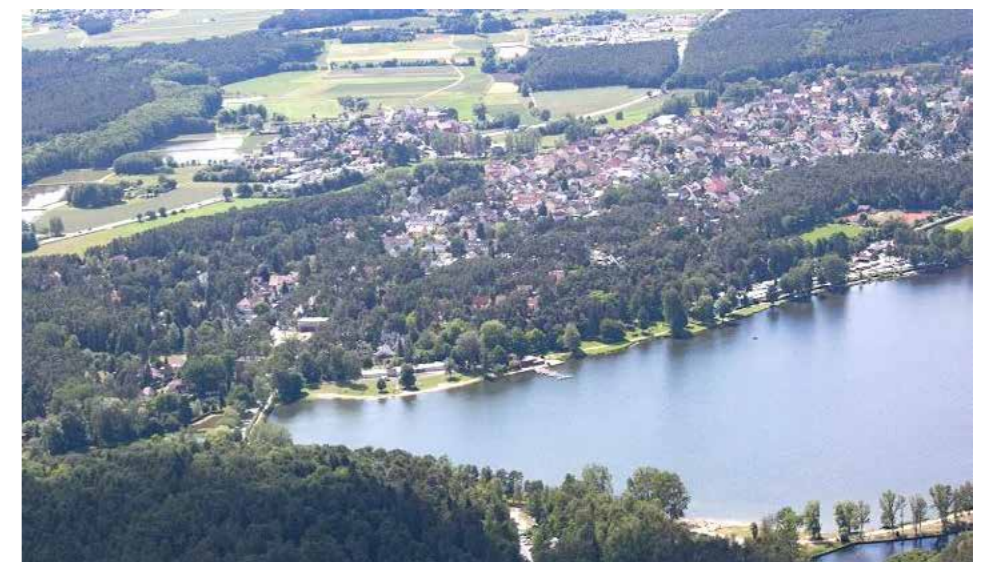
Neuere Luftaufnahme von Dechsendorf aus dem Jahr 2017

Offensichtlich erhofften sich die Bürger von der Stadt eine zügigere Anpassung an die Standards der Zeit und insgesamt eine bessere Berücksichtigung ihrer Anliegen. Von der Bayerischen Staatsregierung war im Zuge der landesweiten Gebietsreform eigentlich vorgesehen, dass Großdechsendorf als selbständige Gemeinde eine Verwaltungsgemeinschaft mit den Seebachgrundgemeinden Heßdorf und Großseebach bilden sollte. Zur Vertretung der