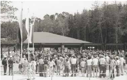
Einweihung Naherholungsgebiet am 29. Mai 1976