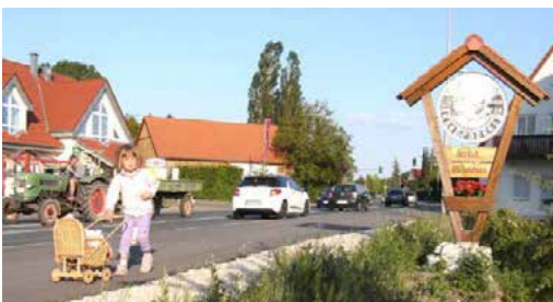
Ortsbegrüßungsschild an der Weisendorfer Straße