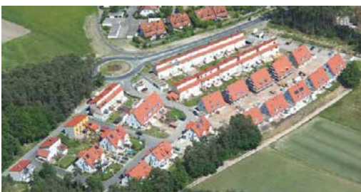
Siedlung Altkirchenweg/Eichelberg an der Röttbacher Straße, Ortsausgang (2005)