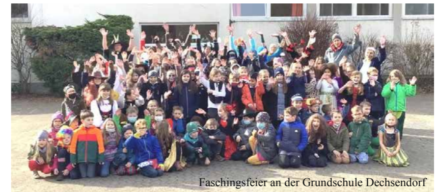
Faschingsfeier an der Grundschule Dechsendorf

Coronabedingt mussten wir allerdings auf unseren beliebten Martinszug mit gemütlichem Beisammensein im November verzichten. Aber die Martinswecken durften natürlich nicht fehlen! Dankeschön