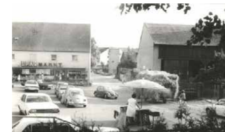
Ortsmitte in den 1970er Jahren

Nach der Eingemeindung musste die Stadt Erlangen die Nachfolgelasten des Kanalbaus und des Straßenbaus übernehmen. Die verkehrliche Anbindung des Ortsteils an die Stadt wurde verbessert, und der Ausbau des katholischen Kindergartens finanziell unterstützt. Eine dring-