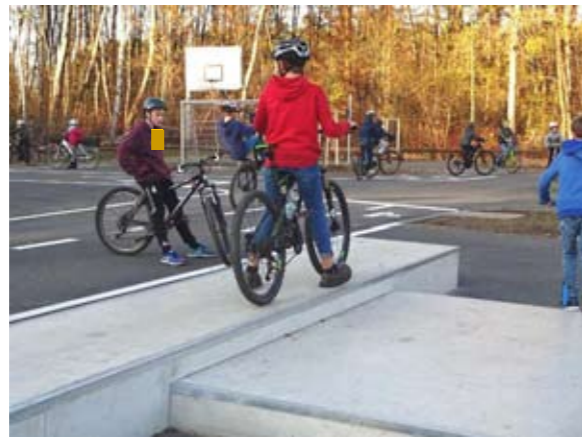
Der Spielbereich auf dem Multifunktionsplatz ist von Kindern und Jugendlichen sehr gut angenommen

Nachdem die Nutzung als Verkehrsübungsplatz bereits im September der Bestimmung übergeben wurde, ist nun Mitte November auch der zweite Bereich des Multifunktionsplatzes an der Schule mit den Spielgeräten für größere Kinder im Rahmen einer kleinen Feierstunde