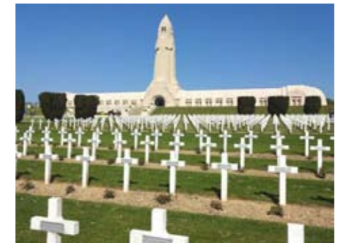
Soldatenfriedhof mit Beinhaus in Verdun – bedrückendes Mahnmal an die Greuel des 1. Weltkrieges

achteten Gedenkrede der Opfer von Krieg und Gewalt an Kindern, Frauen und Männern gedacht. November 1918 steht für das Ende des Ersten Weltkrieges. Heute, 100 Jahre später, sind die Militärfriedhöfe, die sich entlang der alten Kampflinien erstrecken, gottlob zu Stätten der Begegnung, des Gedenkens und der Versöhnung über Gräber hinweg geworden. Nach der erbitterten Feindschaft sind die erreichten Annäherungen außerordentlich bemerkenswert. Aus dem Erbe einer konfliktreichen Geschichte ist eine enge Zusammenarbeit erwachsen.