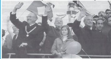
Hafeneinweihung 1970; OB Heinrich Lades (li), Ministerpräsident Goppel, Verkehrsminister Leber