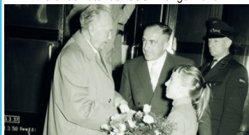
Bundeskanzler Konrad Adenauer wird 1957 in Erlangen herzlich willkommen geheißen