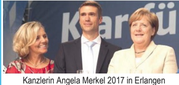
Kanzlerin Angela Merkel 2017 in Erlangen