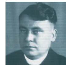
Dekan Ambros Neundörfer Gründervater der CSU Erlangen 1946