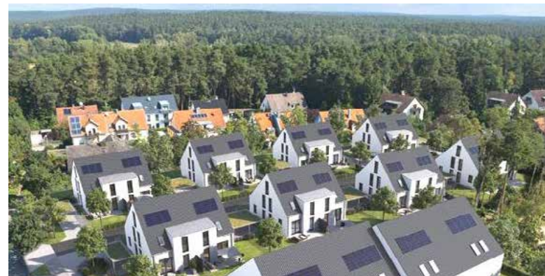
Blick auf das Areal in Richtung Norden. Die geplanten Häuser sind mit dunklen Dächern eingefärbt. In der linken unteren Bildecke ist die Bischofsweiherstraße zu erkennen