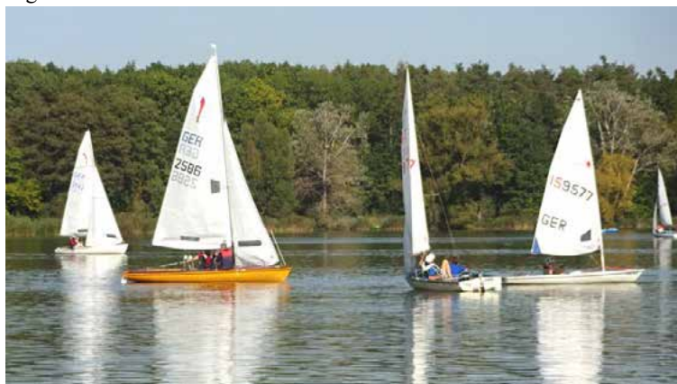
Segeln auf dem Dechsendorfer Weiher im Sommer 2021

Kempe GmbH & Co. ELO-Mineralöl KG heizoel@elo-mineraloel.de www.elo-mineraloel.de Tel.: +49 (0) 9131 1202 34