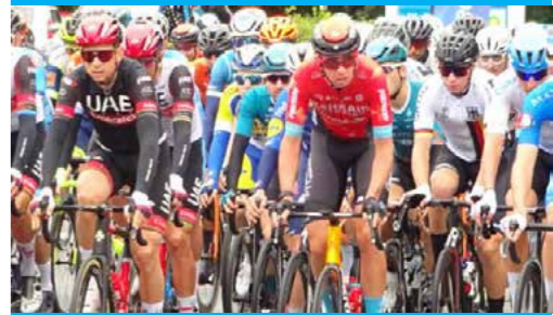
Die 4. Etappe der DeutschlandTour der Radprofis von Erlangen nach Nürnberg führte am 29. August nach dem Start auf dem Erlanger Schloßplatz durch Dechsendorf.