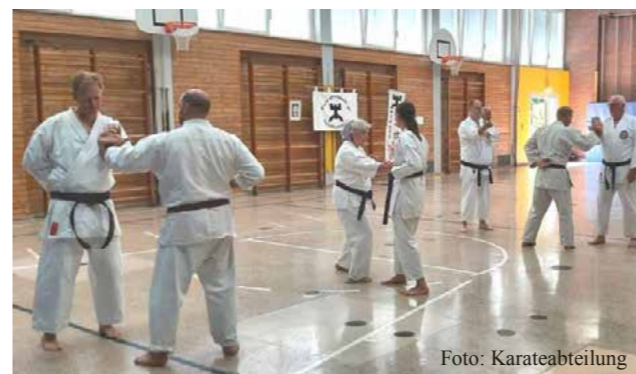
Karate gehört zu den Gewinner-Sportarten in der Corona-Pandemie

Sportlich konnten die aktiven Mitglieder die Angebote über Monate nicht wahrnehmen. Für die meisten der acht Sparten war Sport im Jahr 2020 zunächst noch bis zum Corona-Lockdown im März und dann wieder von Mitte des Jahres bis zum Lockdown im November möglich. In 2021 ging es meist im Mai/Juni erst wieder los und kann hoffentlich offen bleiben.