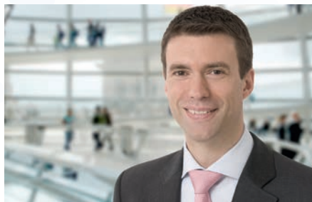
Parlamentarischer Staatssekretär Stefan Müller MdB

Desweiteren soll die Unabhängigkeit der griechischen Statistikbehörde vollständig sichergestellt werden. Als vierte wichtige Sofortmaßnahme ist die Implementierung des Fiskalvertrags sicherzustellen. Bis zum 22. Juli