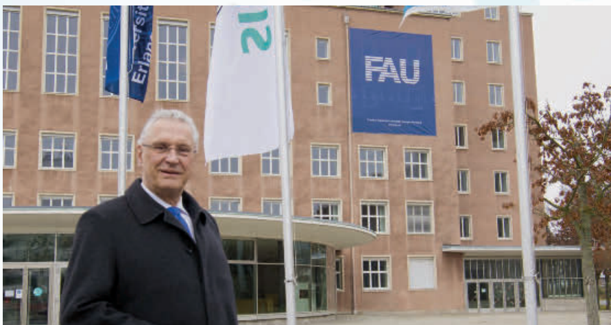
Staatsminister Joachim Herrmann MdB vor dem ehemaligen Siemens-Gebäude

Der Haushaltsausschuss des Bayerischen Landtags hat jetzt die Freigabe für Mittel in Höhe von mehr als 450 Millionen Euro für Umbau, Sanierung und Erweiterung des Himbeerpalasts sowie für den rund 52 Millionen teuren zweiten Bauabschnitt des Zentrums für Translationale Klinische Forschung (TRC II) in Erlangen erteilt.