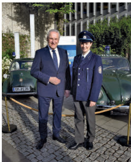
So sahen die Uniformen der Erlanger Stadtpolizei bis 1973 aus und deren Streifenwagen: Isetta und VW Käfer

1968 konnten auch die Polizeien kreisfreier Städte vom Freistaat übernommen werden. Die Erlanger Stadtpolizei wurde 1973 verstaatlicht und in die Bayerische Landespolizei integriert. „Damals wie heute steht fest: Wir können uns auf die Leistungen und die Kompetenz unserer Bayerischen Polizei verlassen“, erklärte der Innenminister. Das zeigt sich auch in der Polizeilichen Kriminalstatistik: Bereits 2021 war Erlangen mit 4.539 Straftaten pro 100.000 Einwohner die zweitsicherste aller 83 deutschen Großstädte mit mehr als 100.000 Einwohnern. Und auch im vergangenen Jahr kann Erlangen eine ähnlich gute Bilanz vorweisen. Diese Entwicklung verdanken wir – so der Innenminister – unseren Polizeibeamtinnen und Polizeibeamten, die hochprofessionelle Arbeit leisten und auch in dieser schwierigen Zeit jede Herausforderung mit großer Einsatzbereitschaft und Motivation angehen.