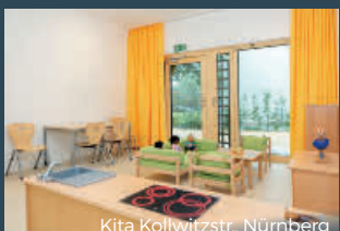
Kita Kollwitzstr., Nürnberg