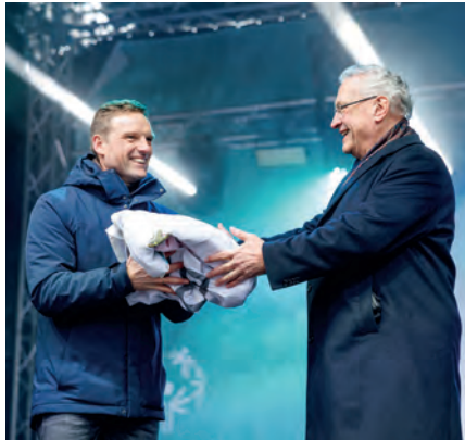
Sportminister Herrmann übergibt die Fahne an Bürgermeister Jörg Volleth

„Unter dem Motto ‚Gemeinsam stark!‘ haben die Organisatoren ein tolles Sportfest auf die Beine gestellt, das Menschen mit geistiger Behinderung vorbildlich an der Freude am Sport teilhaben lässt“, betonte Herrmann. „Ich bin tief beeindruckt von dem großartigen Engagement der vielen Unterstützer und insbesondere auch von den großartigen Leistungen der Athletinnen und Athleten. Inklusion im Sport ist mir als Sportminister ein sehr wichtiges Thema.“ Der Sportminister dankte der Stadt Bad Tölz als Gastgeber sowie allen Förderern und Sponsoren für das ausgezeichnete Engagement zum Wohle des inklusiven Sports. „Ein ganz besonderes Dankeschön geht an das Or-